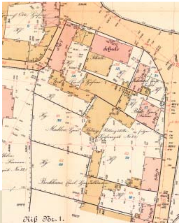
Opmålingsanvisning (Vermesserunganweisung) fra 1876.

De oprindelige opmålinger af hele Sønderjylland i 1870'erne. Målingerne er fremstillet på karton og måler 38 x 51 cm. De opbevares samlet, indbundet i bøger ejerlavsvis. Samlingen fylder ca. 500 bøger. Målingerne er ikke tilgængelig på digital form.