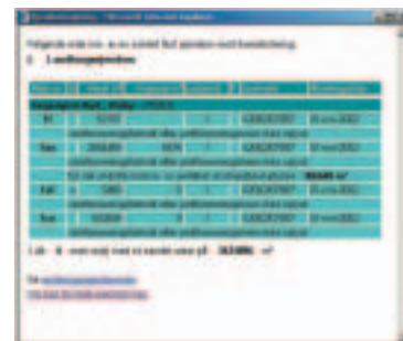
Skærbilledet fra WEB-Matriklen viser et opslag i Matrikelregistret.

Udover en pc skal brugeren have en internet-browser - helst en Internet Explorer. Derudover behøves et plug-in program for at se kortene. Første gang brugeren logger sig på WEB-Matriklen downloades og installeres plug-in programmet automatisk.